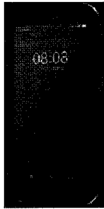
（此图仅供参考，具体以实际采购结果为准）

承担单位提供的资产现场核查工具（手持机）满足地铁各专业承包单位同时进行现场资产核验的实际需求，相关技术要求不低于如下要求：